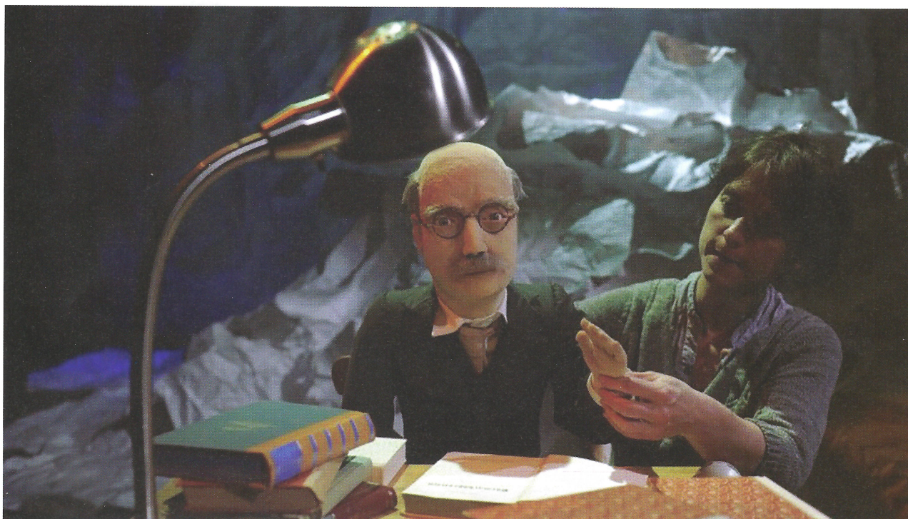
Beeld uit 'The Writer'