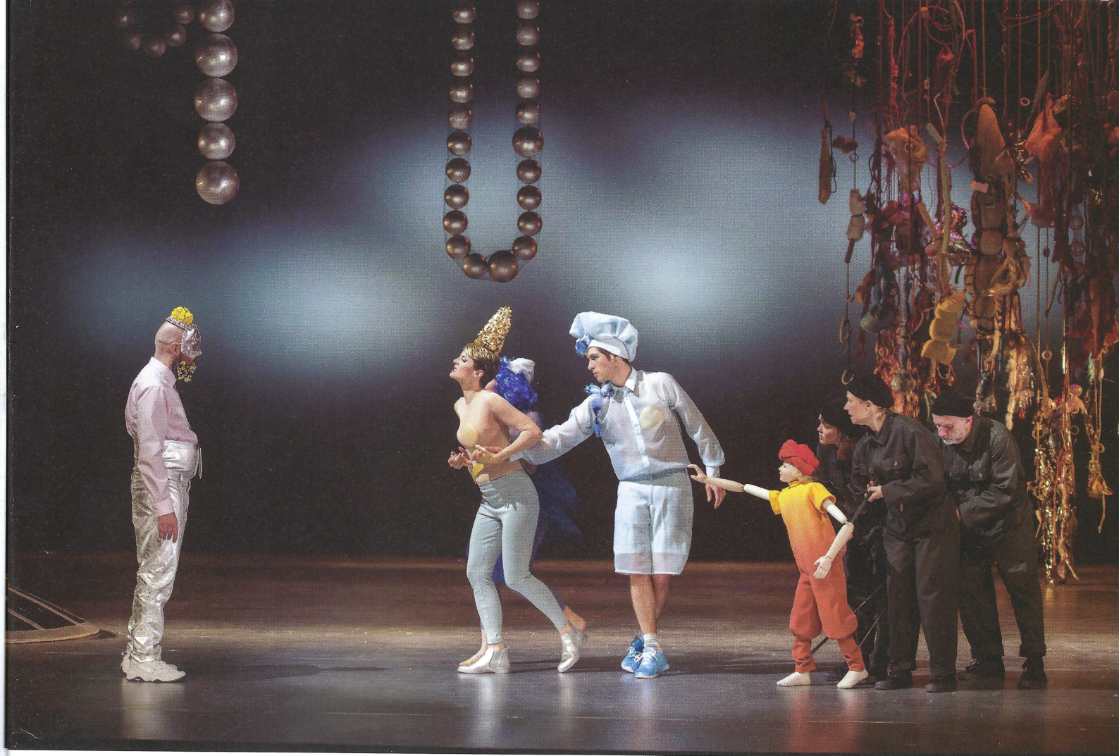
Beeld uit 'The Fairy Queen' in Theater Erfurt